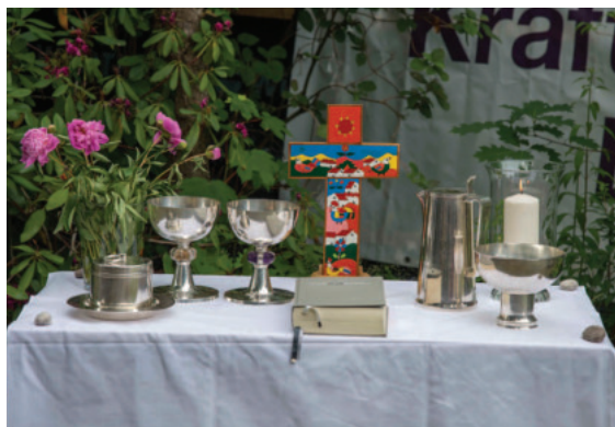
Das Abendmahlsgeschirr von Emmaus.

Seit 1. Januar 2026 stehen in der Ev.-Luth. Kirchengemeinde im Wandsetal durch die Fusion von vier bisherigen Kirchengemeinden vier Kirchen (und Gemeindehäuser) „im Dorf“.