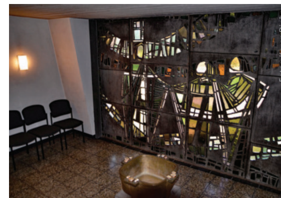
Blick in die Taufkapelle mit dem Taufbecken.